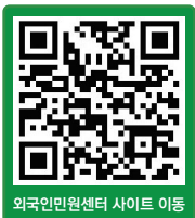
외국인민원센터 사이트 이동

일반 (20, 25, 64, 112) 마을 (6, 92, 92-1, 51)